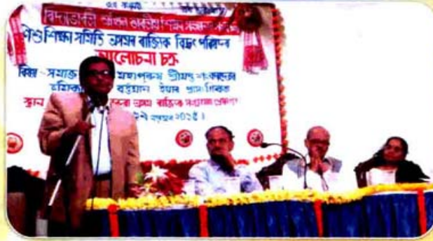
ৰাজ্যিক বিদ্যালয় পৰিষদৰ আলোচনা চক্রৰ এটি দৃশ্য।