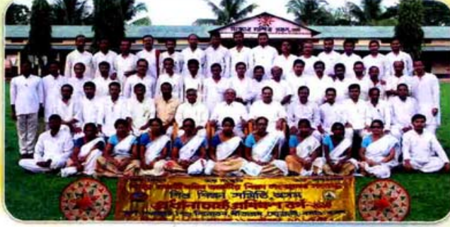
প্রধানাচার্য প্রশিক্ষণ বর্গ - ২০১৫