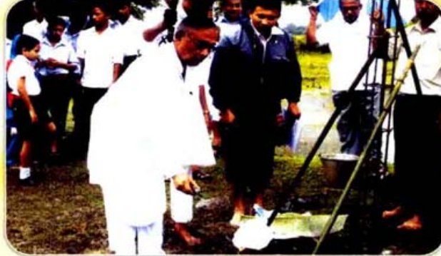
শংকৰদেৱ শিশু নিকেতন, বাগানপাৰাৰ ছোৱালী আবাস গৃহৰ আধাৰশিলা স্থাপনৰ এটি দৃশ্য।

প্রকাশক : সাধাৰণ সম্পাদক, শিশু শিক্ষা সমিতি, অসম, গুৱাহাটী - ২৪ সম্পাদক : শ্ৰী শশী প্ৰভা দাস। সহ-সম্পাদক : শ্ৰী অজয় কুমাৰ বৰা, (অবৈতনিক) যোগাযোগ : ৯৮৬৪২৭২২৩৩ ■ website : www.vbassam.org ■ মুদ্ৰক : ডি. ডি. এছোচিয়েটচ, গুৱাহাটী - ৯